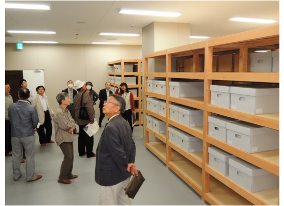
先日実施した文書館見学の様子