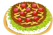
タコライス、デザート